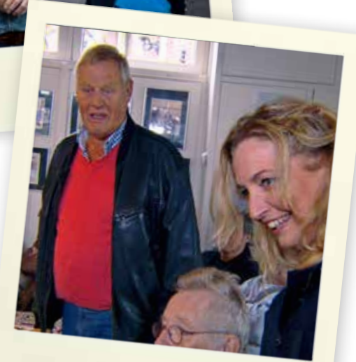
Praathuis De Stegh

kanalen in het achterland van Monnickendam makkelijk de haven van Amsterdam bereiken. Dat scheelde hun een hoop tijd, want anders moesten ze om het eiland Pampus heen varen, een tocht die door de sterke stroming erg lang kon duren. Door via de sluis bij Monnickendam te varen, voorkwamen handelsschepen dat ze dagenlang letterlijk 'voor Pampus lagen'.